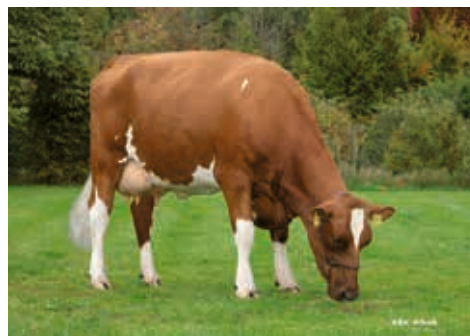
Zufall (1) VG 85, Kunrath, Bokel