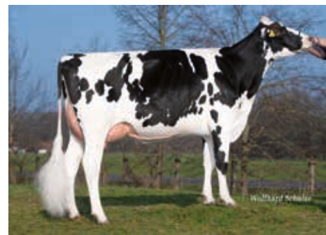
Minna Uck GP 84, Agrargenossenschaft Uckro eG

DE 03 61614595 geb.: 07.09.2019 aAa 324156 A2A2 ET