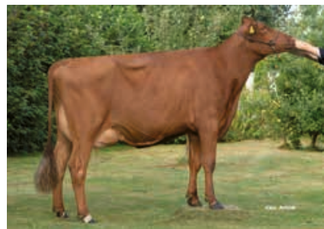
Zwickau (1) GP 82, Fuschera-Petersen, Fahrdorf

VR Redfox v. Rankin Tarona (2) VG 86 6/6 LA 10485 5,42 568 3,76 394 HL 4 12194 5,13 625 3,93 479