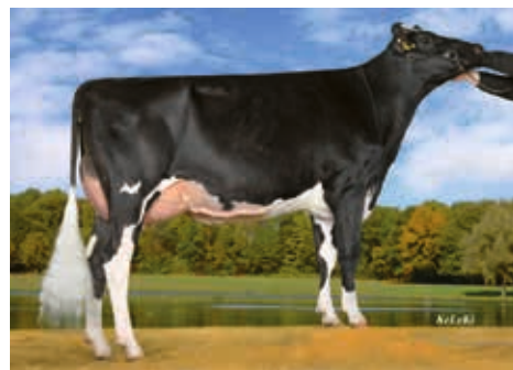
SRS Blackberry (1) VG85, Schulz GbR, Seedorf

DE 01 23451708 geb.: 15.07.2019 aAa 234156 A2A2