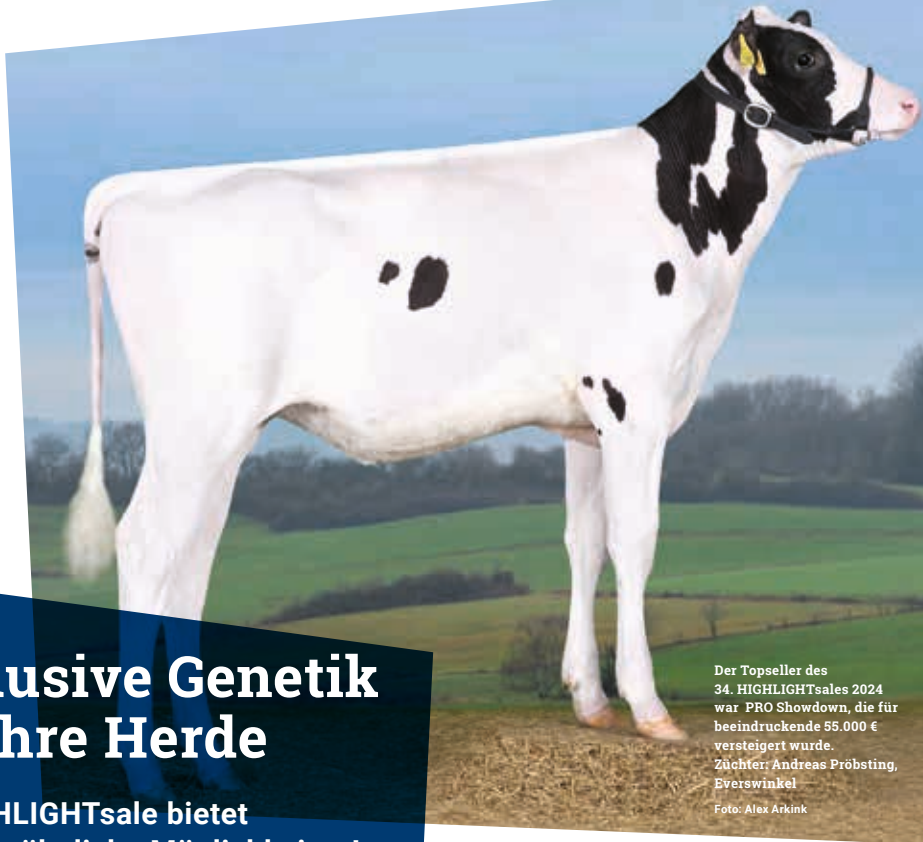
Der Topseller des 34. HIGHLIGHTsales 2024 war PRO Showdown, die für beeindruckende 55.000 € versteigert wurde. Züchter: Andreas Pröbsting, Everswinkel